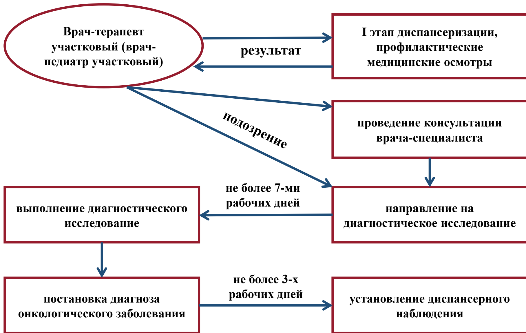
Схема маршрута пациента при подозрении на ЗНО в рамках диспансеризации и профилактического осмотра